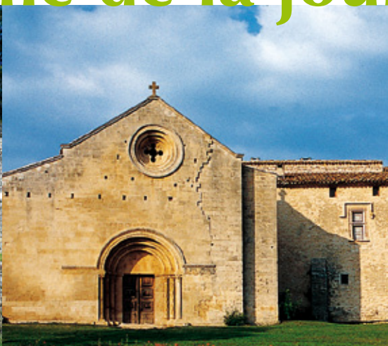
Prieuré de Salagon