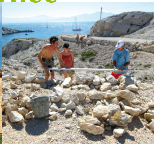
Îles du Frioul